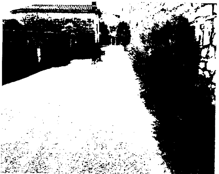
Rue de la Chapelle aux Salelles : Voici en photo le joli travail réalisé par l'entreprise SATP d'Aubenas, financé en partie par CAP TERRITOIRE (aide du Conseil général), plus une participation financière des riverains concernés par la réfection de la canalisation d'eau à l'origine de l'affaissement de la rue.

▲ Nous avons de nombreux enfants qui courent dans le village et des personnes âgées moins valides. Merci de respecter la vitesse de 30Km/h dans le Bourg centre et de 50 Km/ dans la traversée des Salelles.